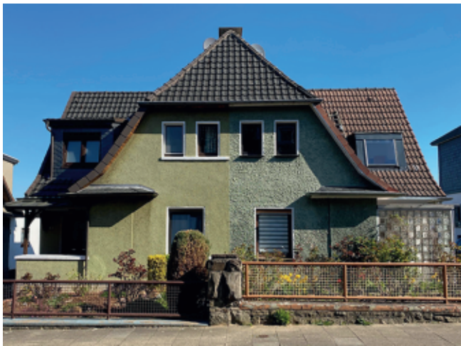
Gartenstraße 42 vorher