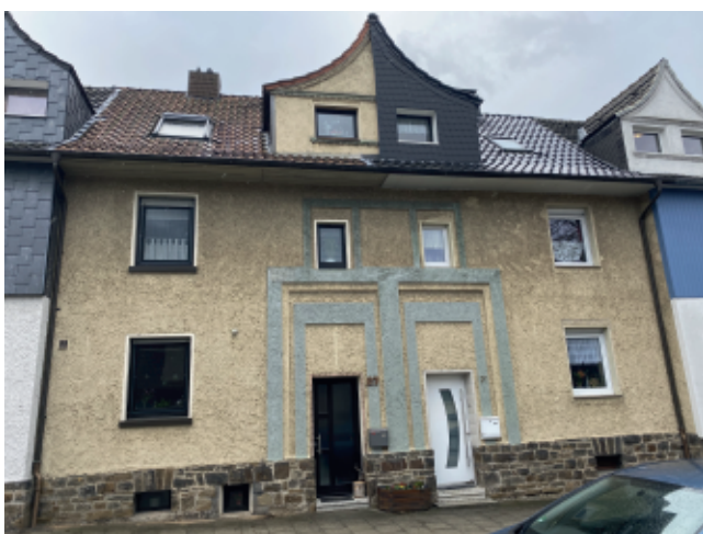
Gartenstraße 27 und 29: vorher