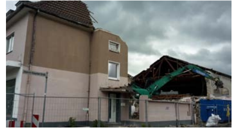
Ein letzter Blick in Welpers ehemaligen Kinosaal.

Dunkle Wolken haben sich über dem Gebäude Thingstraße 46 zusammengebraut.