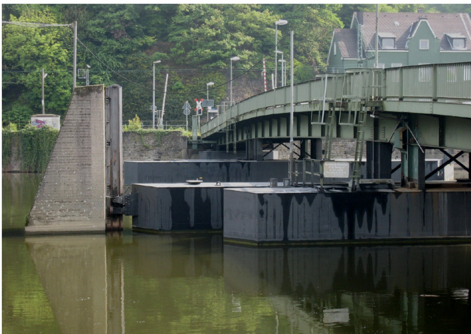
1 Dahlhauser Schwimmbrücke, Auf dem Stade, 2011.

am heutigen Tage mit der Nr. A-317 in die Denkmalliste der Stadt Hattingen eingetragen worden ist.