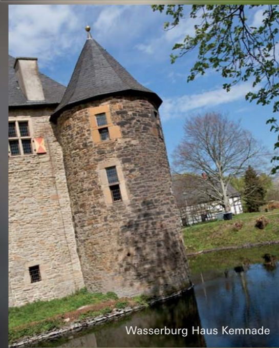
Wasserburg Haus Kemnade

Besonders sehenswerte Kamine hat Haus Kemnade auch heute noch zu bieten. Die vollständig erhaltene Burganlage besitzt wertvolle Innenausstattungen der Renaissance. Im Haupthaus gibt es ein Museum für Musikinstrumente, im ehemaligen Gesindehaus die