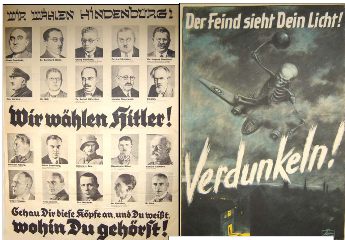
Falsch gewählt – Hitler und die Folgen