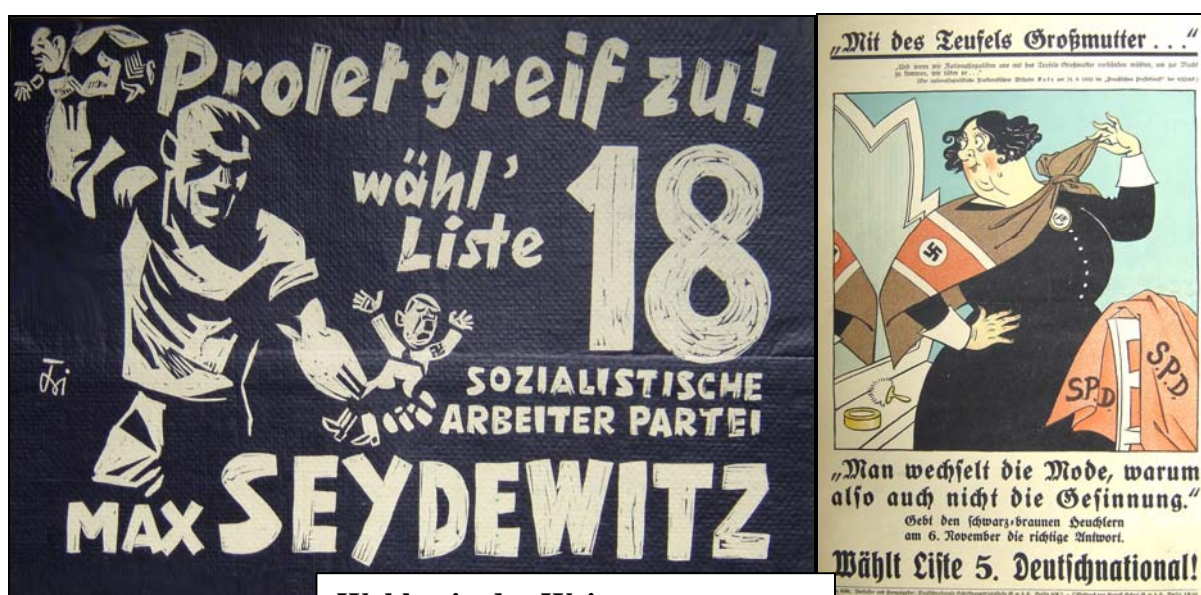
Wahlen in der Weimarer