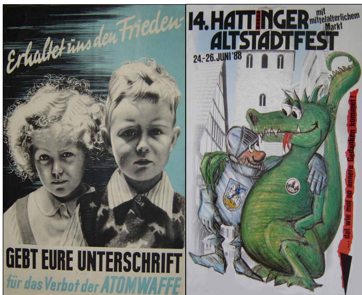
Weltpolitik und Hattinger