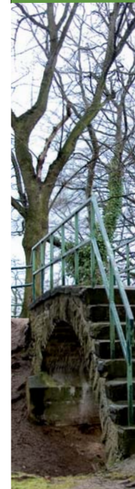
Druck: onlineprinters GmbH, Neustadt a. d. Aisch layout: xchristianeherl

Hattingen | Ruhr Altstadt der Kulturhauptstadt Der Gethmannsche Garten