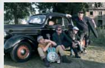
The Faboulous Guitar Gangsters

Den Schlusspunkt setzt die Band „The Faboulous Guitar Gangsters“ aus Recklinghausen. Hier ist der Name Programm: Gitarrenorientierte Rockmusik von den 1980ern bis heute. Aber nicht die hundertste Coverversion, sondern eigene Arrangements mit Mut zum Neuen.