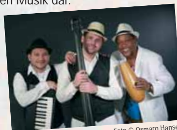
Trio Sonando

Das Trio Sonando aus Kuba präsentiert kubanische Salsa und Musik vom Buena Vista Social Club. Die drei Vollblutmusiker verstehen es, den Sound aus Kuba mit Klavier, Bass und Gesang authentisch, aber doch modern rüber zu bringen.