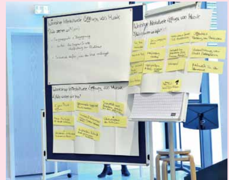
Fachtag in der Städtischen Musikschule Hamm, Oktober 2018

Beide Fachtage waren darüber hinaus geprägt von beeindruckenden musikalischen Beiträgen von Ensembles, die sich innerhalb des Projektes an den Musikschulen gegründet hatten.