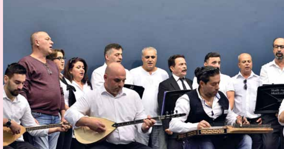
Fachtag in der Städtischen Musikschule Hamm, Oktober 2018

Bisher fanden zwei Fachtage im Rahmen von Heimat: Musik statt. Musikschullehrkräfte und -leitungen aus NRW sowie weitere Akteur:innen aus der Arbeit mit Geflüchteten konnten sich bei diesen Veranstaltungen austauschen und Anregungen für die zukünftige Arbeit einholen.