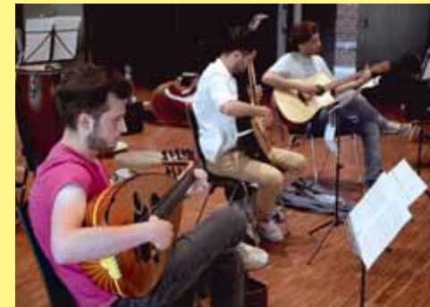
Erste Präsenzprobe des Ensembles in Bochum