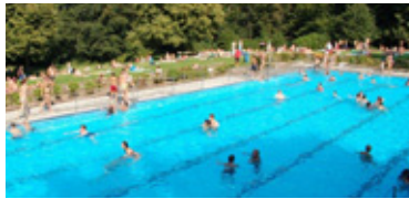
Freibad Welper