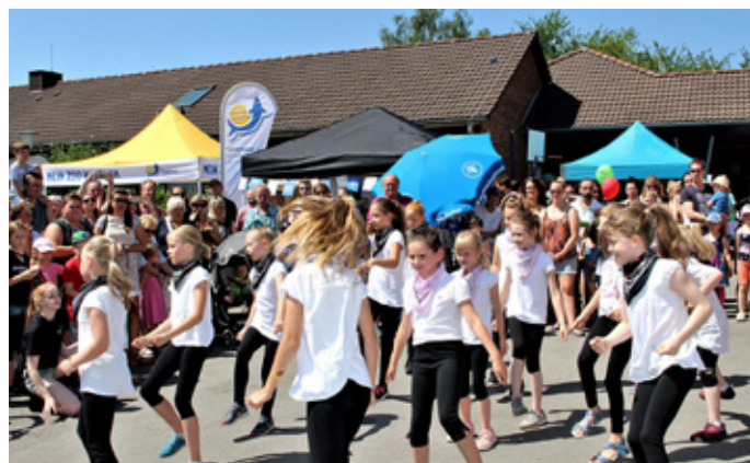
Einmal im Jahr feiert das Hattinger Bündnis für Familie das Bündnisfest, jedes Jahr an einer anderen Schule. Alle Partner haben die Möglichkeit, sich vorzustellen.