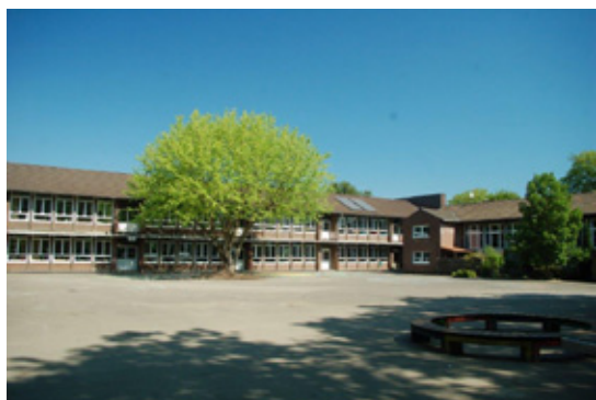
Grundschule Erik-Nölting

Frau Moch (Schülerfahrtkosten) Telefon: 02324 204-4272 s.moch@hattingen.de