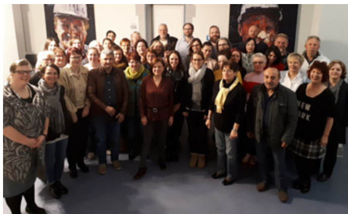
Viele Partner treffen sich regelmäßig beim Hattinger Bündnis für Familie , um sich auszutauschen und zum Beispiel Seminare oder Info-Veranstaltungen zu besprechen.