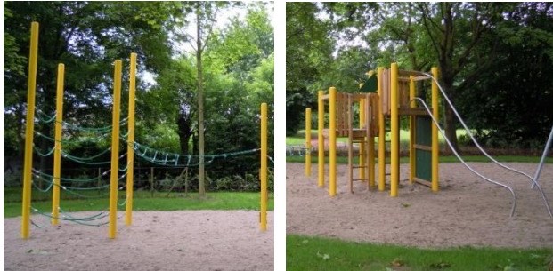
Beispiel Kletterangebot mit Geländerrutsche, Fa. fhs