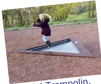
Beispiel Trampolin, Fa. Hally Gally