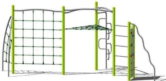
Beispiel Kletterangebot mit Rutschstangen, Fa. Spielgeräte Maier